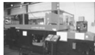
無人ベンディングライン ASTRO - 540

ISO取得支援事業や生産管理ソフト開発事業、券売機・自動出札機等の高精度板金加工の製造を行う。