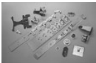
製造される自動車部品